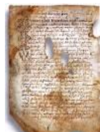
Псковская судная грамота

Двинская уставная грамота 1397 года. Мздоимство упоминается в русских летописях XIV века, например в Двинской уставной грамоте 1397 года в статье 6: «А самосуда четыре рубли, а самосуд то: кто изыснав татя с поличным, да отпустит, а себе посул возьмет, а наместники доведаются по заповеди, ино то самосуд, а опричь того самосуда нет». Там же, в статье 8: «...а черес поруку не ковати, а посула в железех не просити; а что в железех посул, то не в посул».